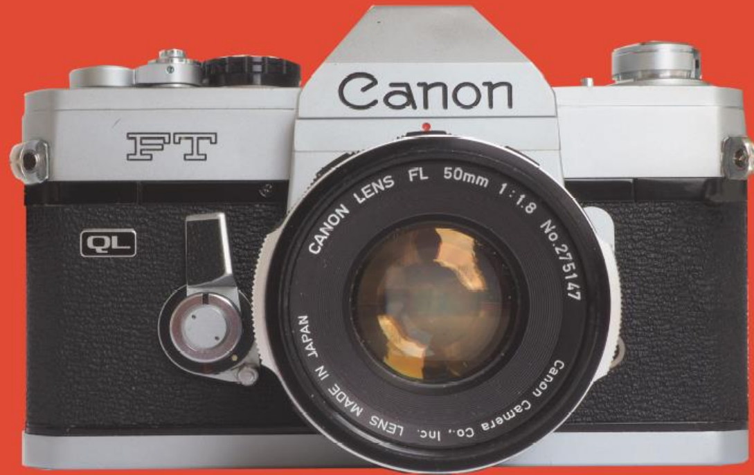
Sammlung von Cyril Kajnar