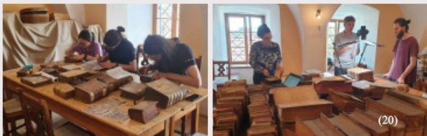
Inventariere, fotografiere și documentare – cercetare desfășurată în 2022-2023 în cadrul proiectului sponsorizat de Ministra de stat pentru Cultură și Media a RFG: „Cultura scrisului și lecturii la Mediaș în secolele XIV-XVI. Protejare, reconstrucție virtuală și analiză științifică a unei biblioteci parohiale și gimnaziale transilvănene”.

Totuși, vreme de decenii, încă din anii 1960, biblioteca și arhiva asociate cu parohia evanghelică din Mediaș au beneficiat de atenție și grijă competentă, încercându-se permanent inventarierea materialului disponibil. În acest context a survenit în anul 1968 restaurarea valorosului manuscris de predici („Mediascher Predigtbuch”, ilustr. 12). Acțiuni de restaurare au fost întreprinse (în urma unor inițiative private), și la începutul anilor 2000, fiind astfel salvat un incunabul, prin colaborarea cu laboratorul de resort de la Muzeul Național al Unirii din Alba Iulia (ilustr. 19). Restaurarea cărților vechi este o mărturie a îmbinării tradiției și inovației. Munca meticuloasă a specialiștilor nu numai că păstrează integritatea fizică a cărților, dar asigură și accesul generațiilor viitoare la moștenirea culturală și istorică conținută de acestea.