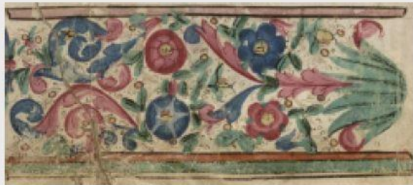
Ornament floral din indulgența acordată în 20 Martie 1493 pentru altarului Sf. Martin din biserica Sf. Margareta din Mediaș.

Zwecks besserer Sichtbarkeit wurden die Bucheinbände für die Ausstellungsbesucher auf Papier abgepaust.