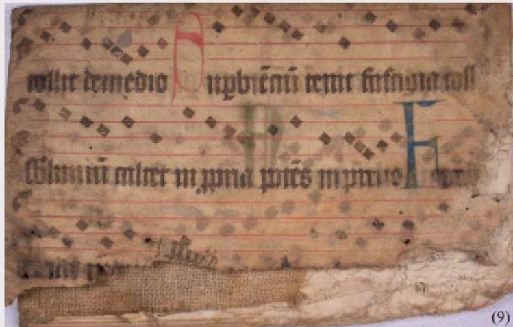
Fragment dintr-un manuscris liturgic (sec. XV); imnul Mittit ad Virgine face trimitere la sărbătoarea Bunei Vestiri. Notafie muzicală și inițiale redat cu roșu și albastru. A fost folosită probabil în biserica parohială din Medias.

Die Handschriftenfragmente sind sozusagen das Echo der bedeutenden katholischen Pfarrbibliothek. Nach der Reformation wurden die Pergamenthandschriften zu Buchumschlägen „umgewidmet” und sind so erhalten geblieben.