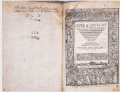
(11) Erasmus de Rotterdam: Opera Divi Caecilii Cypriani Episcopi Carthagensis , Basileae, tipărița / Druckerei Froben, 1521.

Cele dintâi impulsuri ale Reformei inițiate de Martin Luther (1483–1546) în 1517 la Wittenberg au fost resimțite în Transilvania încă din deceniile trei și patru ale aceluiași secol, într-un context politic, religios, social și intelectual dinamic. Tiparul și educația școlară – în spiritul umanistic promovat de către Philipp Melanchthon (1497–1560) – devin agenți esențiali ai receptării și consolidării noii doctrine religioase, precum și a filosofiei sociale care o însoțește. În predici, în învățământ și în scrieri se folosește acum limba germană. Biserica și școala devin elemente esențiale ale identității sașilor. Merită reținut faptul că reforma luterană în Transilvania nu a urmat traseul radical din alte regiuni, favorizând aspecte de continuitate în raport cu tradițiile medievale catolice.