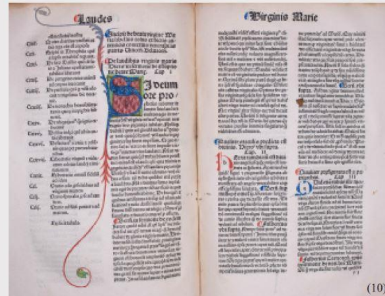
Vincencius Bellovacensis: Opuscula. Scilicet: Liber gratie; Laudes Virgine Marie; De Sancto Johanne evangelista; De eruditione filiorum regalium; Consolatio pro morte amici . Basel, tipărița Johann Amerbach, 1481. Decorul incunabulului provine probabil, din așa-numitul atelier „Vigiliale”, activ în zona Brașovului și Sibului pe la 1500.

Inkunabeln , Drucke aus der Zeit vor 1501, trugen wesentlich zur Herausbildung der intellektuellen Elite – vorwiegend des Klerus – in Siebenbürgen am Ende des Mittelalters bei.