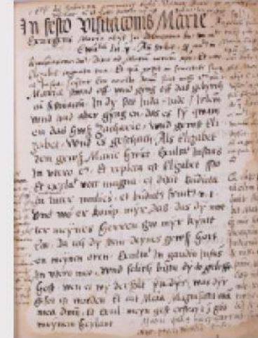
(12) Sermones de tempore, de sanctis, de communis sanctorum („Cartea de predici din Mediaș / „Mediascher Predigtbuch”), ca.1535–1537, fol. 9.