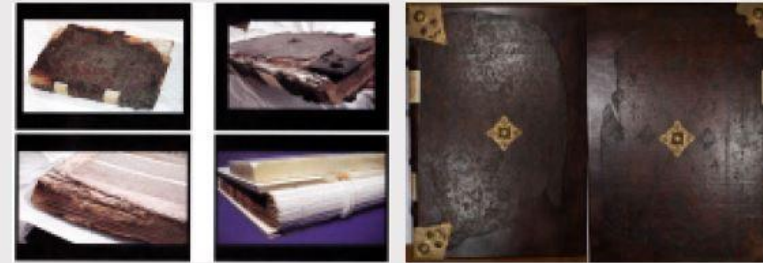
Antoninus Florentinus: Summa theologica, pars II . Nürnberg, tiparnița Anton Koberger, 1486, Incunabulum, înainte și după restaurarea din 2002, în laboratorul specializat din Alba Iulia.

Atenția de care s-a bucurat patrimoniul scris medieval și modern timpuriu medieșean a oscilat de-a lungul vremii. Situația bibliotecii parohiale și școlare a devenit îngrijorătoare după ocuparea sovietică și instalarea regimului comunist. În toamna anului 1945 un primar, pe cât de zelos, pe atât de ignorant, ajungea la concluzia că toate cărțile bibliotecii ar avea un conținut fascist și ar trebui aruncate în foc. Un rug în curtea liceului „Stephan Ludwig Roth” urma să le pecetluiească soarta. Însă mai mulți profesori și elevi curajoși au reușit să ascundă piesele mai vechi și deosebit de valoroase în biserică. După trecerea pericolului iminent, acestea au fost depozitate în secret într-un turn din incinta castelului, unde au rămas până în anul 2022.